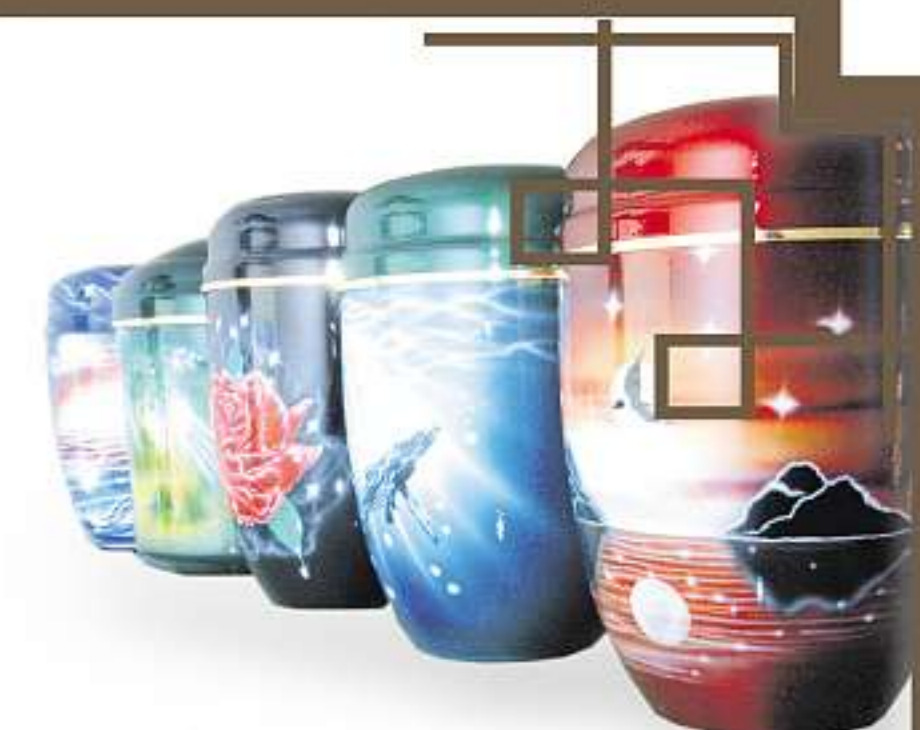
LEBENDIGE MOTIVE FÜR DEN LETZTEN WEG: Wolken, Kraniche, Wälder, aber auch schon mal ein Motorrad oder Fotos aus dem Leben eines Verstorbenen finden sich auf den Urnen des Mihlaer Bestattungsinstitutes Böhnhardt.