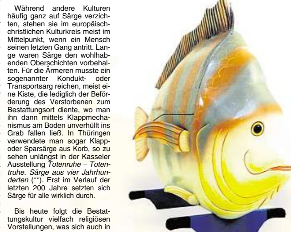
ANDERE KULTUREN – ANDERE TOTENRITUALE: In Afrika haben Figurensärge eine lange Tradition. Dieser in einer süddeutschen Privatsammlung aufbewahrte Fischesarg stammt aus einer Werkstatt in Ghana, die auch Särge in Form einer Zwiebel oder eines Jumbo Jets herstellt. Nach dem Motto „Wie das Leben, so der Sarg“ würde dieses Motiv für einen Fischer gedacht sein. Die farbige Bemalung mache die Särge zu echten Kunstwerken, die auch Eingang in Ausstellungen (**) und Museen finden.