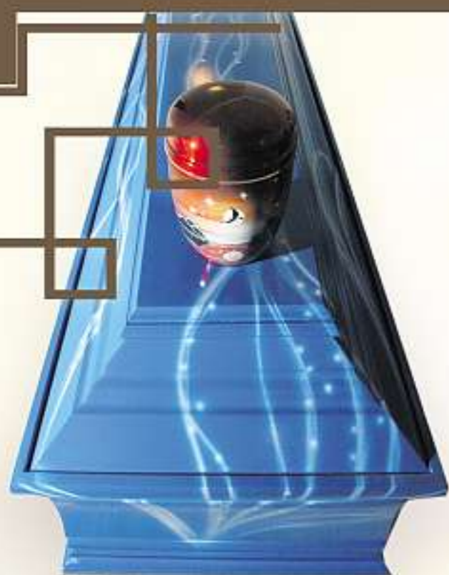
DER TOD, SO INDIVIDUELL WIE DAS LEBEN: „Blue Dream“ heißt dieser Sarg des Mihlaer Bestattungsinstitutes Böhnhardt. Angefertigt werden die besonderen Totentruhen und -urnen nach den Vorstellungen der Hinterbliebenen in Sizilien.